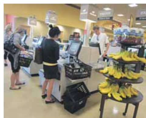
'Zelf-check-out' voor de zelfscanner. Met daarbij als impulsproduct: bananen en rozijnen. Zit de Canadees daarop te wachten? Hemmes: "Moeilijk te zeggen, maar het zijn wel 'gezonde impulsen'. Niet de single-chocoladeproducten of koek of suikerwerk zoals in de meeste Nederlandse supermarkten."

in dit werelddeel trokken de Amerikanen zich terug. De supermarkten die Safeway er opende, zijn nu in handen van Woolworths. En Woolworths deed er ook iets vreemds mee. Alles werd omgebouwd tot Woolworths-vestigingen, maar in de staat Victoria hield Woolworth de naam Safeway aan. Het bedrijf bouwde in die staat zelfs Woolworths-vestigingen om tot: Safeway. Maar uiteindelijk zag Woolworths ook in dat dat niet de weg was, en bouwde ook die in Woolworths om. Dat ombouwproces is nog niet klaar, waardoor er her en der nog Safeway-supermarkten in Victoria te vinden zijn.