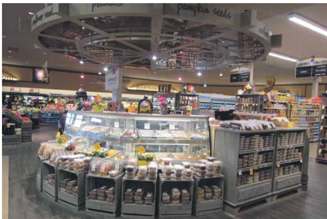
Zo'n Safeway heeft plek genoeg, dus is er ook nog ruimte voor een notenbar. Hemmes: "Bijzonder. Gezonde, natuurlijke producten. In zelfschep en voor u opgeschept in bakjes. Bij deze afdeling staan ook notenmaalmachines voor pinda's, amandelen en andere noten. Maar je kunt ze ook al gemalen meenemen, in die bakjes."