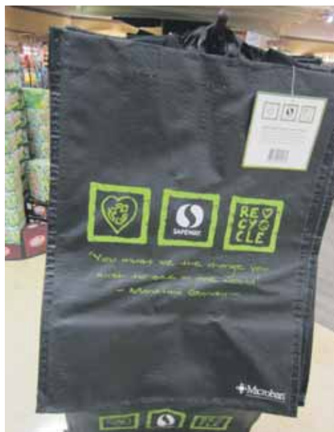
Een van de Safeway-boodschappentassen, de sjiekere. Met daarop 'You must be the change you wish to see in the world', van Mahatma Gandhi.