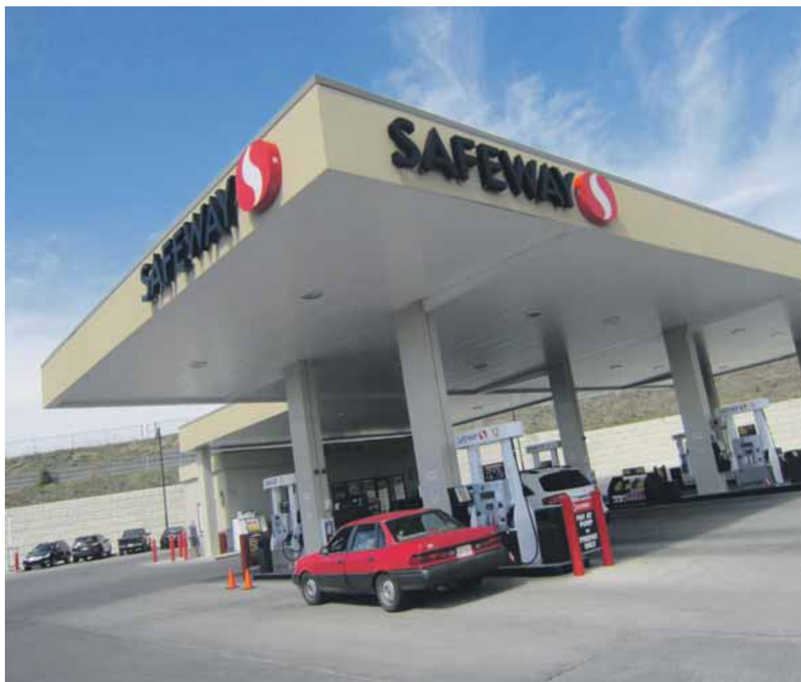
Een Safeway-pompstation. Tweederde van de Safeway-vestigingen in de VS en Canada heeft een pompstation erbij. Safeway heeft er een speciaal spaarprogramma voor: wie voor 35 Canadese dollar boodschappen doet, krijgt vijf dollar korting op een volle tank.

Safeway is te groot om het een regionale speler te noemen, althans in de VS, maar het is niet verspreid genoeg om het een landelijke speler te noemen. Wellicht is landelijke speler wel het grote doel geweest in al die jaren. Safeway heeft ketens al vanaf de jaren twintig van de vorige eeuw overgenomen; het gaat dan om lang geleden verdwenen levensmiddelenwinkelketens en zelfbedieningszaken met hooguit een regionale