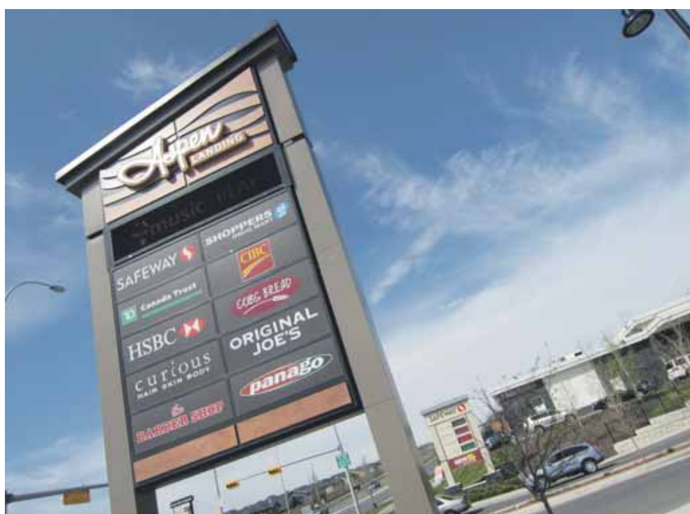
Linksboven op dit bord van winkelcentrum Aspen Landing (nabij het Canadese Calgary) zien we het Safeway-logo: een S, die twee velden scheidt, in een yin-en-yangvorm.