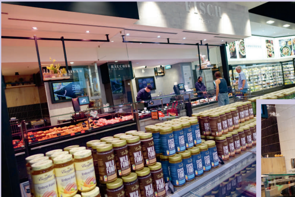
De langgerekte afdeling met vlees en vis naast elkaar. In de buurt daarvan: vleeswaren, met de nadruk op Italiaanse salami maar ook vele andere worstsoorten uit dat land. En, hé, wéér een presentatie met olijfolie, maar nu in combinatie met pasta. En dan nog wat antipasti, in een hoekje.