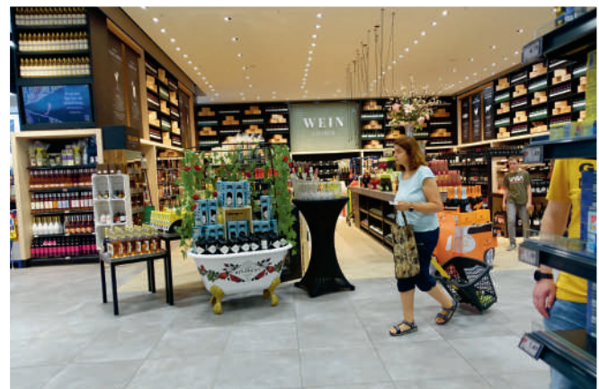
De grote broodpresentatie met vooral mediterrane brood bevindt zich binnen in de Edeka zelf. Met weer die typerende aankleding. Bakkerszaak Büsch, in de grote hal voorafgaand aan de Edeka, ziet er heel anders uit, en heeft bediening. Even een zijstapje ook: een supermarkt met een badkuip... Het is de presentatie van 'Hendrick's Gin', een gin van de Schotse gedistilleerdproducent William Grant & Sons.

H&M. Die laatste twee zijn bekende namen voor de Duitse klant. Maar er is ook een Trinkgut, de drankwinkelformule van Edeka. Je zou zeggen, een beetje zoals een Gall & Gall bij een Albert Heijn, ja, maar anders dan een Nederlandse slijterijformule bieden 'Getränkeshalle' zoals Trinkgut niet alleen bier, wijn en gedistilleerd, maar juist vooral bier, frisdrank en water en die laatste twee veelal in volumeverpakkingen. De betere wijnen zijn juist in die Edeka te vinden, niet in een Trinkgut. Dat is wel een verschil met de Nederlandse detailhandel. En als je dat alles met Nederlandse supermarkten