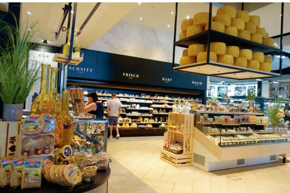
De kaasafdeling, met ook hier veel gevoel voor decor en verleiding. De grote wand en de grote Italiaanse 'parmigiano reggiano'-kazen vallen als eerste op, en links daarvan de bedieningsafdeling. Uiteraard met een enorm aanbod.