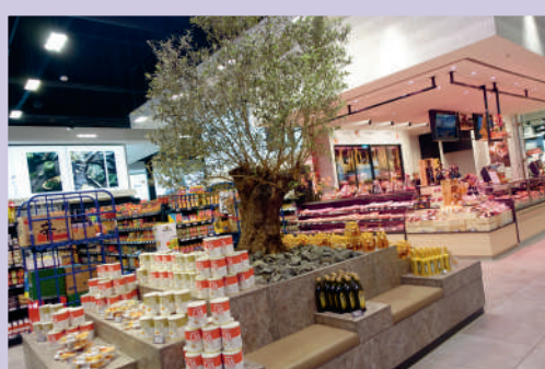
Hoe Italiaans of anders mediterraan is het allemaal? Bij de kassa's staat groot op de wand 'arrivederci' (tot ziens). En bij de versafdelingen van vlees en vis zien we een presentatie met olijfolie, mét een olijfboom.