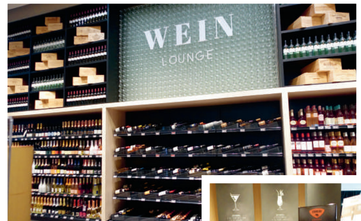
De wijnafdeling mag er ook zonder meer zijn. Met uitleg over wijn bij vis, bij pluimvee/gevogelte, bij rundvlees, bij kaas, bij groente en bij desserts. De betere wijnen zijn liggend gepresenteerd. En er lijkt wat te proeven te zijn, als we kijken naar wat er op tafel staat: een koeler met champagne, wijnglazen, bakjes en bronwater om de smaak te neutraliseren. En dan ergens op een hoekje bij al die wijn: een humidor met exclusieve sigaren! Kennelijk mag dat zo in Duitsland?