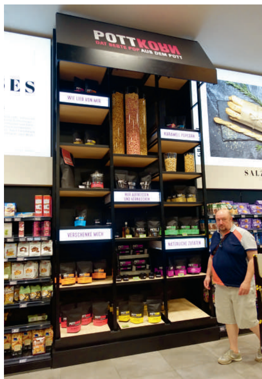
Tussen al die Italiaans getinte aankleding zien we ook gewoon een assortiment dat kennelijk uit de regio komt: popcorn van het merk 'Pottkorn'. 'Pott'? Ja, het Roergebied met z'n grootschalige mijnbouw en zware industrie werd jarenlang de 'Kohlenpott' genoemd, de 'kolenpot' dus. De stad Moers, waar deze Edeka gevestigd is, maakt deel uit van dat gebied. Op de site van Pottkorn, uit Oberhausen, is te lezen dat er eerst sprake was van een koffiebranderij, maar er was een kok die een keer popcornmais in de koffiebrander deed, gewoon om te kijken wat dat zou opleveren – en zo ontstond het idee.

niet kunnen overtuigen. En in deze tijd van de bezuinigende consument en inflatieperikelen lijkt een supermarkt vol verleiding, hoogwaardige aankleding, een premiumaanbod etc. als deze eigenlijk geen slim idee. Je klanten kopen dan impulsief wellicht te veel en balen dan bij de kassa van het kassabonbedrag – maar: die houding en modus, dat zal dan toch voorbijgaan, nemen we toch aan? Een Edeka als deze is ook niet opgezet voor deze tijd van zuinig aan, maar veeleer voor als dat weer voorbij zal zijn.