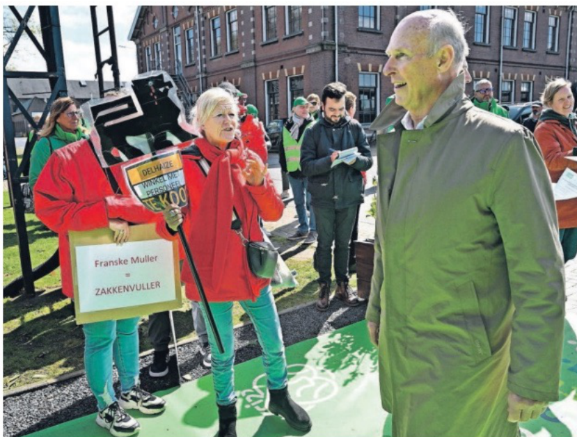
Protest bij de aandeelhoudersvergadering van Ahold Delhaize.

De FNV kan de 'graaiflatie' of 'winstflatie' niet hard maken, maar staat niet alleen in het opmerken van het fenomeen. Recent zeven bestuurders van de Europese Centrale Bank (ECB) op de rol van de winst bij de inflatie, met de